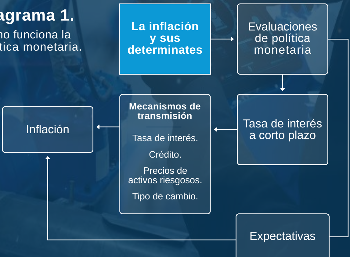
Diagrama 1. Cómo funciona la política monetaria.